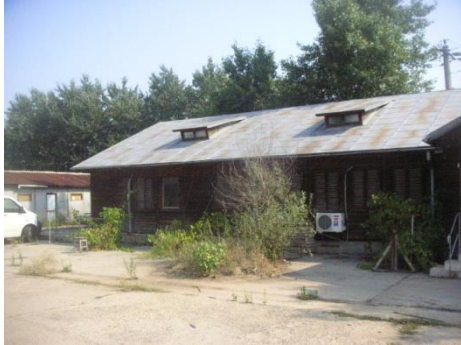
Baraca lemn ptr.birouri