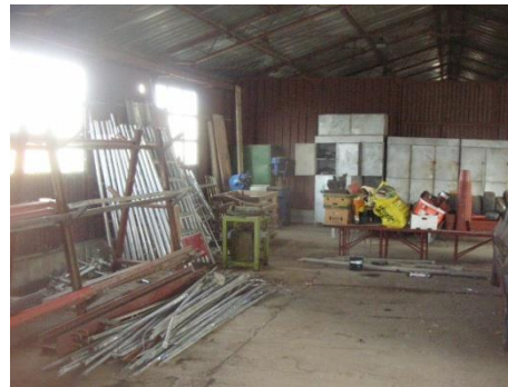
Baraca metalica atelier+magazie