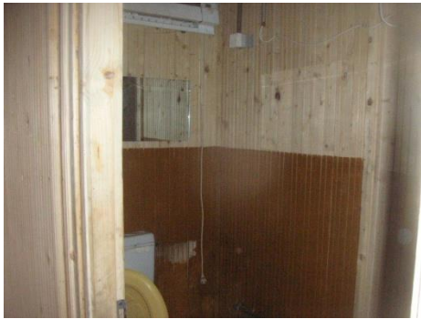
Baraca lemn ptr.birouri