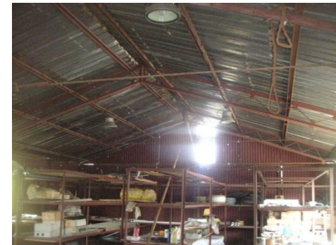
Baraca metalica atelier+magazie