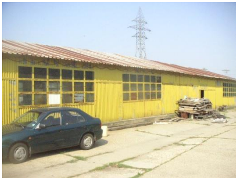
Baraca metalica atelier+magazie