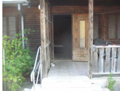
Baraca lemn ptr.birouri