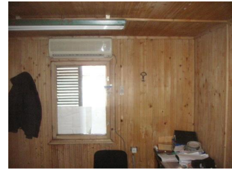
Baraca lemn ptr.birouri