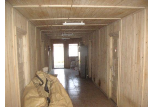
Baraca lemn ptr.birouri